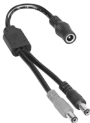
SPLITTER CABLE (RED | BLACK) 12952