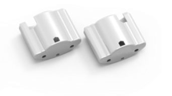
PLASTIC END CAPS (1200/1450mm) 13650