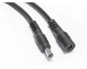
EXTENSION CABLE 10847