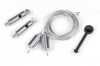
KIT STAINLESS STEEL CABLE 10840