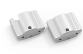
PLASTIC END CAPS 13649