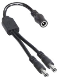
SPLITTER CABLE (BLACK | BLACK) 11146